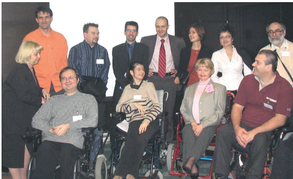
Mešovita delegacija Srbije na Konferenciji „Korak ka Evropi“; 2005. godine u Sarajevu