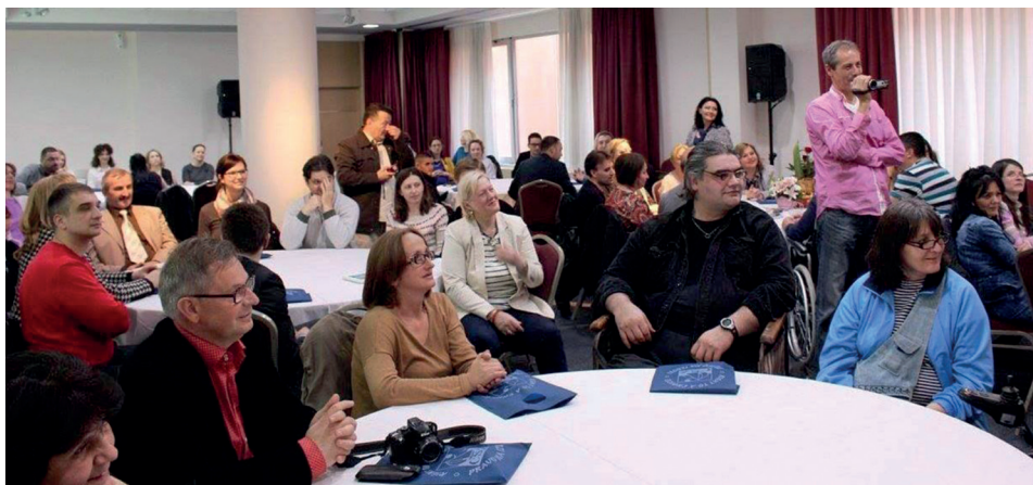
Fotografija sa obeležavanja 20 godina postojanja i rada CSŽ Srbije, 2016. godine