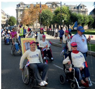
Učesnici/e na Freedom Drive 2011. godine iz Srbije i Bosne i Hercegovine

Ono što bi trebalo unaprediti u vezi sa ovom manifestacijom jeste da na kraju budu donošeni konkretniji radni zaključci o daljoj akciji o čijoj bi se realizaciji i uspesima razgovaralo na sledećem Freedom Drive, čega sada u pravoj meri još uvek nema. Nisam sigurna da imamo jasnu i merljivu predstavu da li smo sa ovom manifestacijom, od svog početka 2003. pa do danas učinili neke veće promene, osim što smo možda zainteresovali veći broj učesnika iz različitih zemalja da se pridruže zahtevima ENIL-a. U početku, dok su tu bili Adolf, Džon Evans i Martin, koji su stvarno legende pokreta, i imali su ideju šta hoće da postignu to je imalo smisla. Ali oni su se pomalo umorili