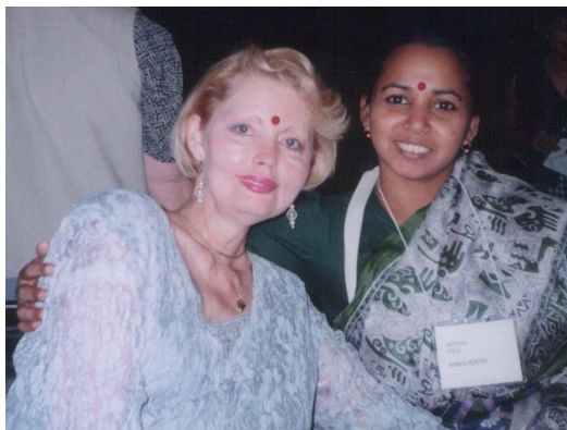
Na Forumu žena sa invaliditetom u Vašingtonu 1997. godine sa kolegicom iz Indije

Jedno od tih putovanja koga se sećam je odlazak u Vašington juna 1997. godine, na Međunarodni forum liderki sa invaliditetom. Na Forumu je bilo oko šesto žena iz celog sveta. Bilo je interesantno i važno videti kako žene sa invaliditetom iz mnogih zemalja preuzimaju vodeće uloge, uključujući i poznate žene liderke invalidskog pokretaposebno iz Sjedinjenih Američkih Država, čije je učešće predstavljalo i dodatnu podršku i motivaciju za ostale učesnice ovog Forumu.