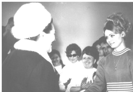
Gordana pozdravlja Jovanku Broz na otvaranju bolnice

ocima odluka i izdejstvovala da bolnicu dođe da otvori Jovanka Broz. Tako je taj događaj dobio publicitet i značaj.