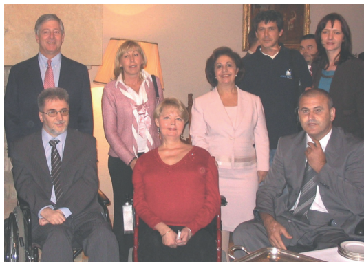
Sa prijema na Dvoru, 2006. godine