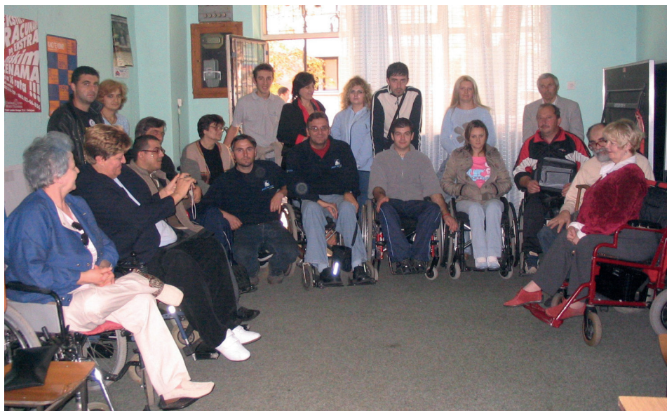
Korisnici i personalni asistenti na jednoj od obuka u Jagodini, 2005. godine

Osnovao je Centar u Leskovcu, koji vodi i danas, a pre nekoliko godina osnovao je i svoju štampariju, postao preduzetnik! U dvorištu svoje kuće izgradio je jednu malu štampariju koja je po svim standardima i tako sada on brine o majci koja je još živa umesto da očekuje pomoć drugih. U jednom periodu bio je i član Veća Skupštine opštine Leskovac zadužen za socijalna pitanja, te se praktično bavio i politikom.