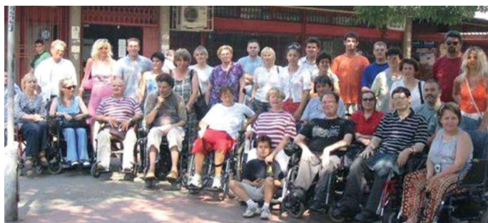
Jedan deo korisnika/ca i personalnih asistenata/kinja u okviru projekta SPAS, Beograd 2005. godine

Da bi obezbedili bar donekle sigurnost korisnika, svi kandidati za personalne asistente prolazili su psiho testove u Nacionalnoj službi za zapošljavanje, a pre toga ispunjavali posebno kreirane upitnike, da bi se o njima dobile osnovne informacije. Korisnici su takođe ispunjavali posebno dizajnirane upitnike u koji-